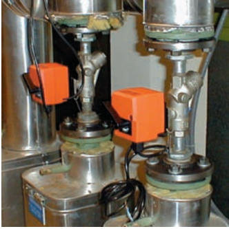
Die Druckunabhängigen Regelkugelhähne von Belimo sorgen für einwandfreien hydraulischen Abgleich und helfen einiges an Zeit, Kosten und Energie zu sparen

Informationspunkte behandelt, sind es bei der Ausbaustufe „Medium“ schon 1.000 und mit Paket „Large“ lassen sich bequem mehr als 10.000 Informationspunkte verwalten. In allen drei Paketen stehen dem Anwender leistungsfähige Software-Module zur Verfügung.