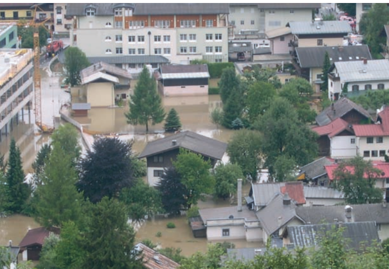
Das Krankenhaus Mittersill wurde 2005 vom Hochwasser überflutet und dank unermüdlichen Einsatzes der Beteiligten in der Rekordzeit von 54 Tagen saniert